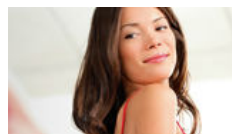
Abdominoplastia La importancia de dar el paso con la seguridad de un entorno hospitalario.