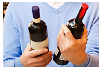
Si te gusta el vino, debes saber esto Vignerons