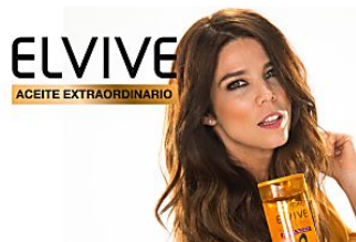
Realiza este pequeño test para saber qué necesita tu pelo Elvive