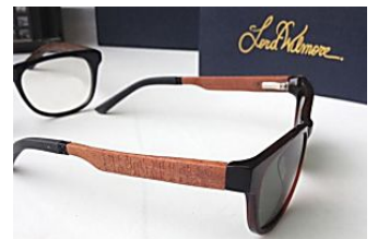
La revolución del mundo de las gafas graduadas Yorokobu