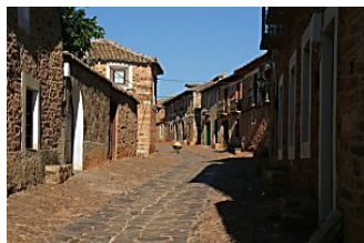
Los pueblos más bonitos de toda España Simpatia.es