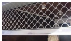
Cierres puertas metálicas Cerrajería E. Merino, fabricación y montaje de cierres metálicos