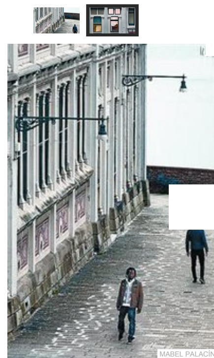
Otro de los detalles de la fotografía principal.

Últimos vídeos de cultura : Las estrellas de Bollywood visitan Madrid