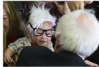
El bebé de la campaña de Bernie Sanders, Baby Sanders, fallece de muerte súbita