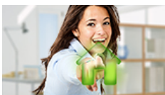
Hipoteca EspañaDuero La que necesitas, con excelentes condiciones y a tu medida. Pregúntanos y verás